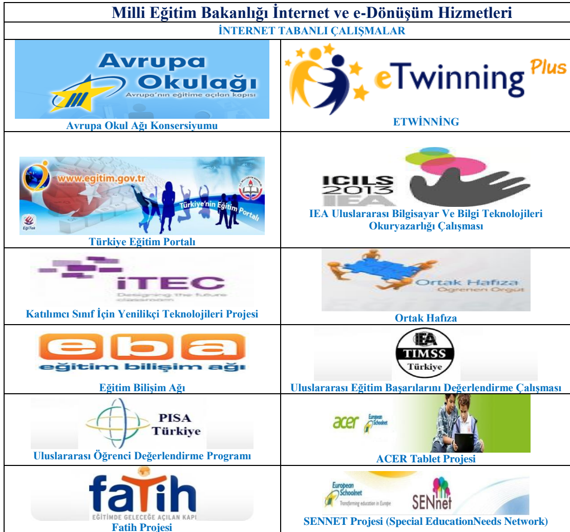
Tablo 1: WEB Tabanlı Çalışmalar

Bakanlığımız internet ve e dönüşüm hizmetleri kapsamında yapılan çalışmalardan bazılarının görselleri aşağıda gösterilmiştir.